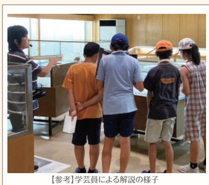
【参考】学芸員による解説の様子