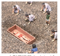
方形周溝墓のイメージ