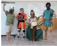
弥生こども紙芝居