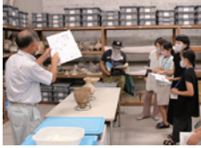
バックヤードの解説の様子

「史跡貝殻山貝塚交流館」の展示品と、普段は公開していないバックヤードの収蔵品を学芸員の解説付きで御案内します。