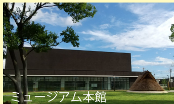
ミュージアム本館