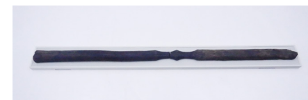
竪杵 2 (817)