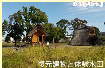
復元建物と体験水田