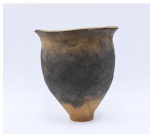
甕形土器 20 (237)