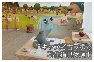
キッズ考古ラボで 弥生道具体験!