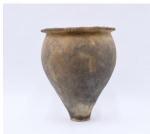
甕形土器 51 (268)