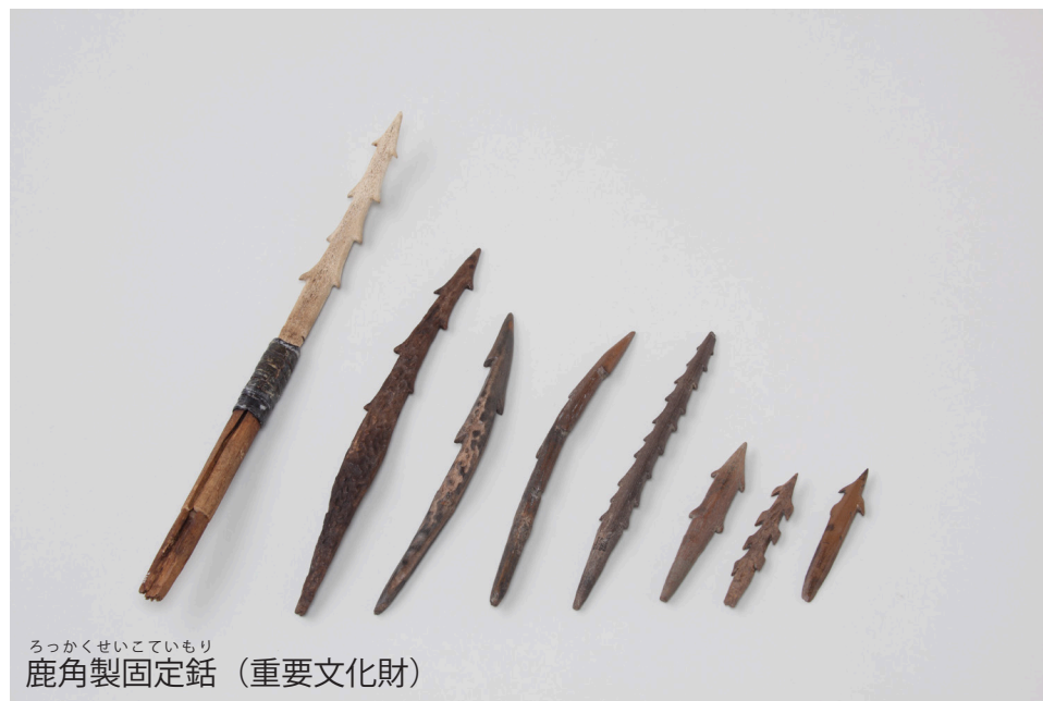
ろっかくせいこていもり 鹿角製固定鈚 (重要文化財)

朝日遺跡は、清須市、名古屋市西区に所在する、弥生時代の大規模な環濠集落です。逆茂木・乱杭などからなる強固な防御施設、埋納された銅鐸、玉作りの工房跡など、重要な発見が相次ぎ、東海地方を代表する弥生集落として知られています。