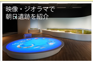
映像・ジオラマで 朝日遺跡を紹介