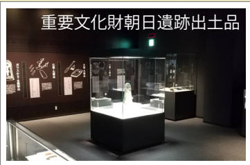
重要文化財朝日遺跡出土品